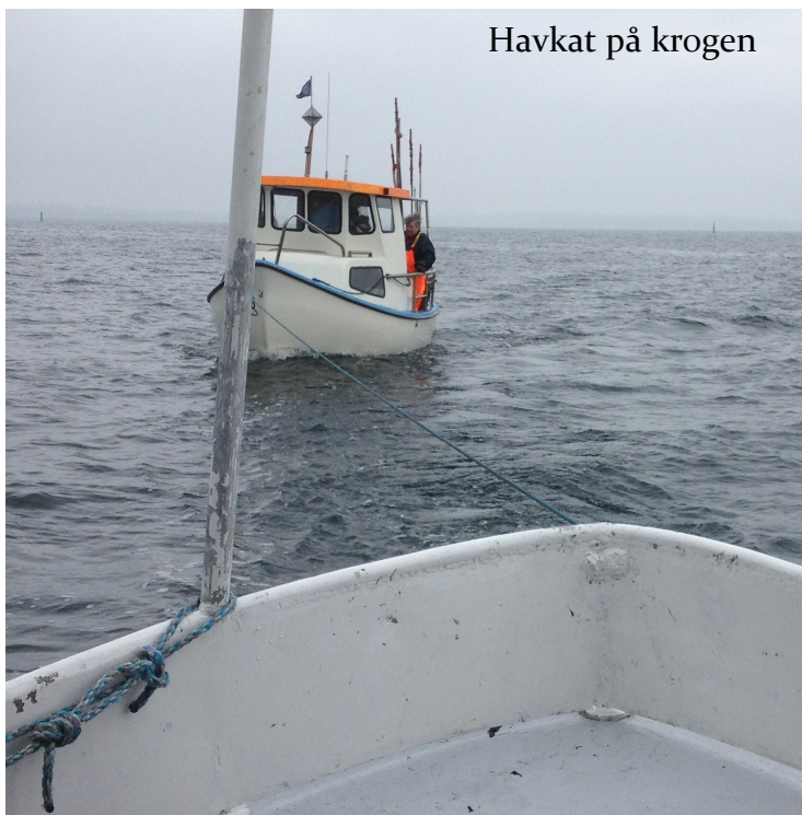
Havkat på krogen