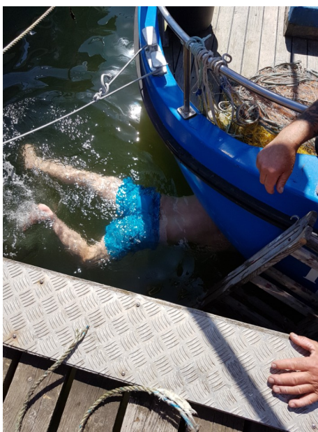
Her ledes efter flere fisk

Dårlig timing for skriverkarlen, men fra fiskerne lyder der en varm tak til den afgående formand for hans slutspurt.