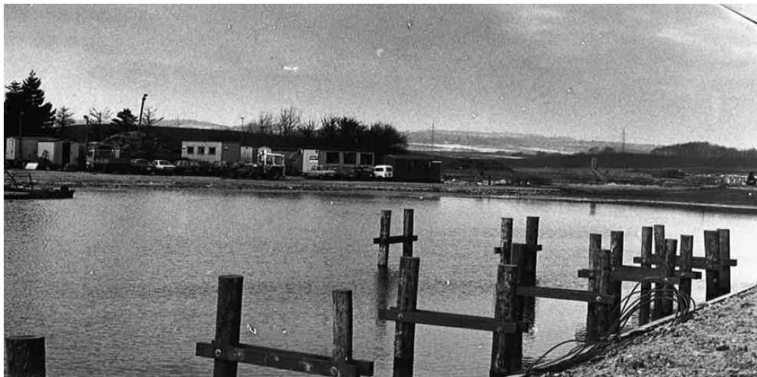
Den gamle havn

blev brugt til fundament af den nye dækmole, læmole mv. Ja sågar de gamle sporgognsskinner fra Ryesgade, kasserede facadeelementer fra Gellerupbyggeriet blev skaffet billigt og kom herud. Rygtet siger at også en hel nedlagt minkfarm endte i Kaløvig fundament.