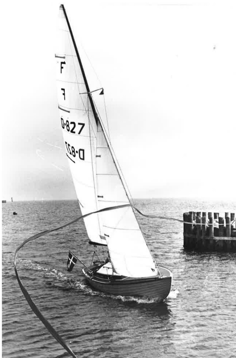
Fra indvielsen af den nye havn, hvor snoren "sejles over"

I sommeren 1983 stod den nye havn færdig til ibrugtagning, og den officielle indvielse og standerhejsning blev foretaget 19. maj 1984.