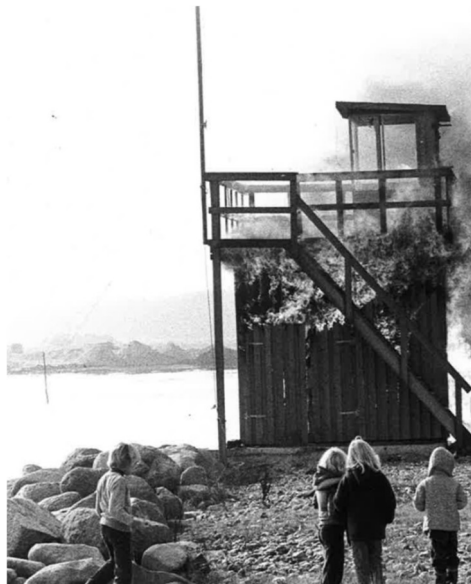
Det gamle dommertårn "futtet af”

Det tog et par år før de første anlægsarbejder begyndte for alvor. En del af aftalen var, at kaløvigerne selv skulle medvirke med